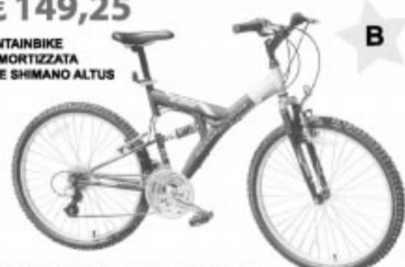
2 ANNI DI GARANZIA E ASSISTENZA GRATUITA

* Chiusura iscrizioni: lunedì 28 luglio 2003. I primi 70 iscritti (35 per l'offerta A e 35 per l'offerta B) riceveranno la comunicazione di accesso al buono sconto via e-mail entro martedì 29 luglio. I buoni sconto non sono cumulabili, sono validi fino al 2 agosto 2003 e sono utilizzabili esclusivamente presso il punto vendita TACCONI SPORT prescelto in fase di iscrizione.