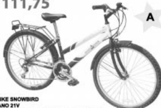
CITYBIKE SNOWBIRD SHIMANO 21V 2 ANNI DI GARANZIA E ASSISTENZA GRATUITA